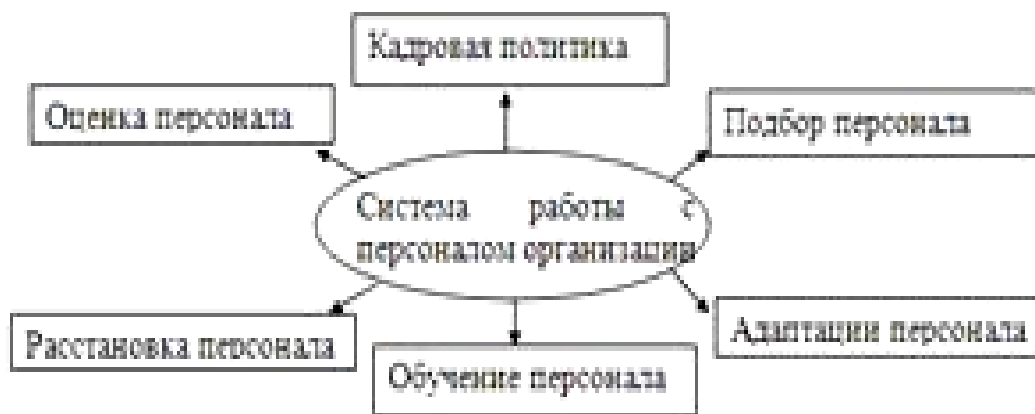
Рисунок 2 – Система работы с кадрами [8, с. 15]

Если рисунок является авторской разработкой, необходимо после заголовка рисунка поставить знак сноски и указать в форме подстрочной сноски внизу страницы, на основании каких источников он составлен, например: