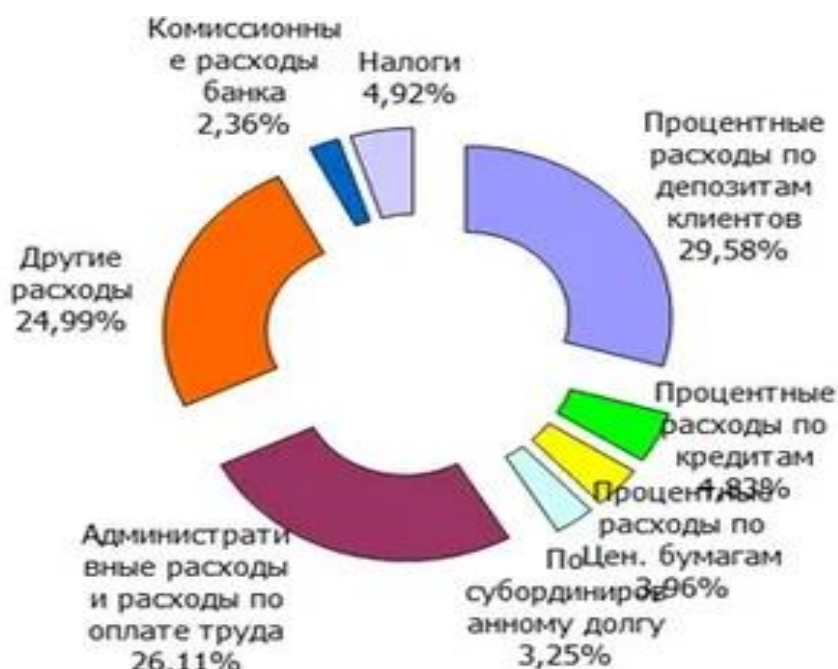
Рисунок 1 – Структура банковских издержек, %

Если на рисунке отражены показатели, то после заголовка рисунка через запятую указывается единица измерения, например: