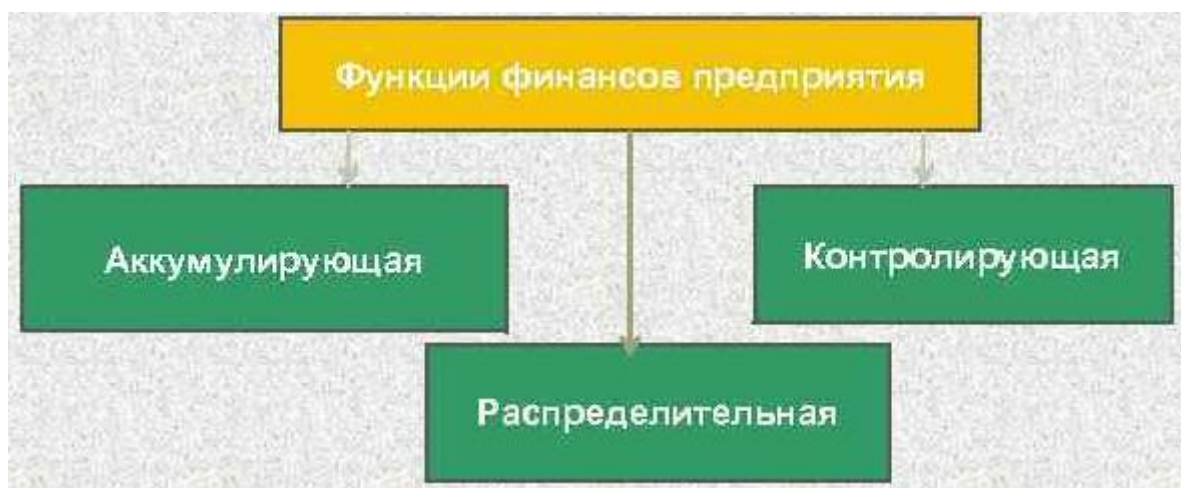
Рисунок 1 – Функции финансов предприятия

Рисунки, за исключением рисунков в приложениях, следует нумеровать арабскими цифрами сквозной нумерацией по всей работе. Каждый рисунок (схема, график, диаграмма) обозначается словом «Рисунок», должен иметь заголовок и подписываться следующим образом – посередине строки без абзацного отступа, например: