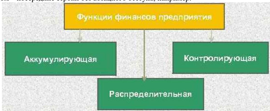
Рисунок 1 – Функции финансов предприятия

Рисунки, за исключением рисунков в приложениях, следует нумеровать арабскими цифрами сквозной нумерацией по всей работе. Каждый рисунок (схема, график, диаграмма) обозначается словом «Рисунок», должен иметь заголовок и подписываться следующим образом – посередине строки без абзацного отступа, например: