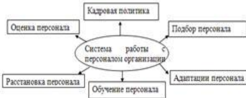
Рисунок 2 – Система работы с кадрами [8, с. 15]

Если рисунок взят из первичного источника без авторской переработки, следует сделать ссылку, например: